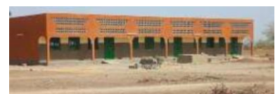
Bau der drei Klassenzimmer